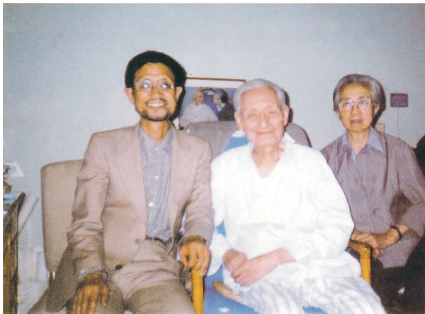
○ 作者与前中国佛教协会会长赵朴老