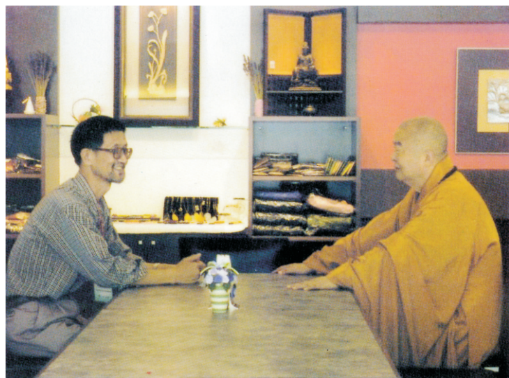
○ 作者与星云云大师切磋佛法